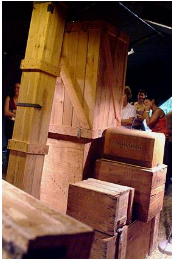
le dispositif scénique