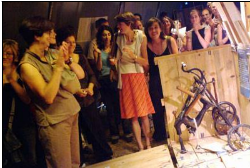
« La singeman »

Jauge : 50 personnes par séances (3 séances par jour ). Durée d'une séance : 45mn + 10 à 15 minutes de visuel. 1 heure de pose entre chaque séance.